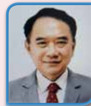
นพ.ปราโมทย์ นิลเปรม อุปนายกคนที่ 3