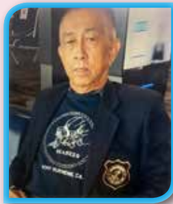
พล.ร.ต.อิสระ ยัมพานิชย์ ที่ปรึกษา