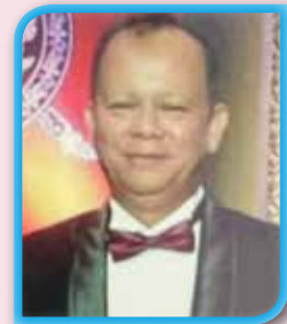
พล.ต.ท.มณฑล เงินวัฒนะ ที่ปรึกษา