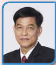
นายประสงค์ นรจิตร อุปนายกคนที่ 1