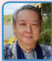
ร.ต.กิตตินันท์ ยะตินันท์ อุปนายกคนที่ 2